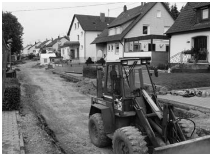
... als nächster Schritt wird der Vollausbau der Straße erfolgen. Insgesamt gehen die Arbeiten zügig voran.