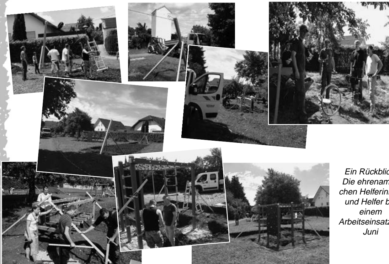
Ein Rückblick: Die ehrenamtlichen Helferinnen und Helfer bei einem Arbeitseinsatz im Juni