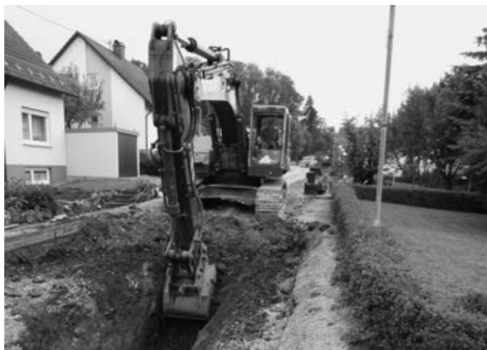
Blick in die Straße „Im Engele“: Die Kanalrohre und Wasserleitungen werden ausgewechselt...