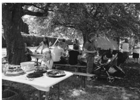
Mit einem Helferfest zu Beginn der Ferienzeit wurde der sanierte Spielplatz erneut seiner Bestimmung übergeben.