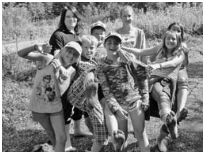
Barfußpark in Dornstetten

Mit einem gemütlichem Lagerfeuer- und langen Grillabend ließen die Jugendlichen mit ihren Betreuerinnen die Ferientage ausklingen und freuen sich schon auf nächstes Jahr.