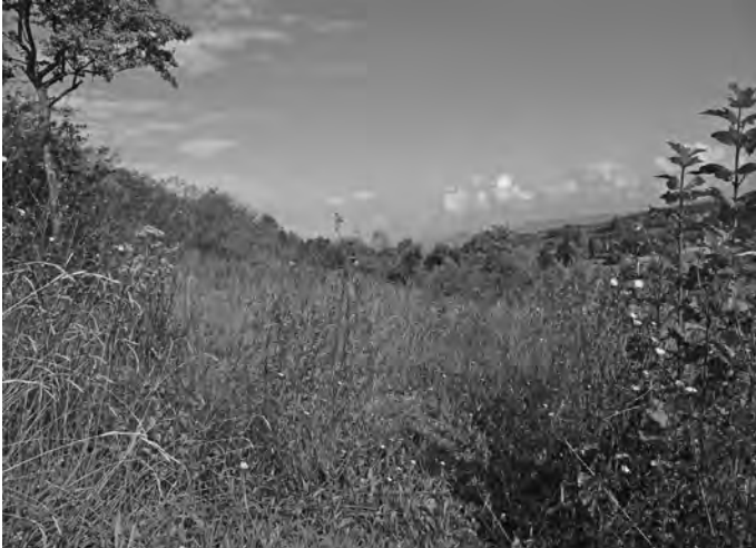
Sommerhalde im Herbst