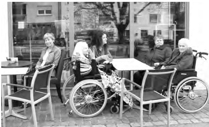
Beim genüsslichen Kaffee trinken vor der Bäckerei Gulde