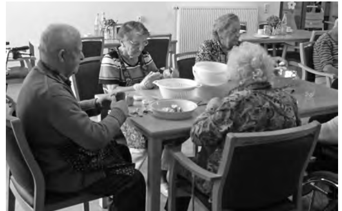
Beim fleißigen Äpfelschneiden