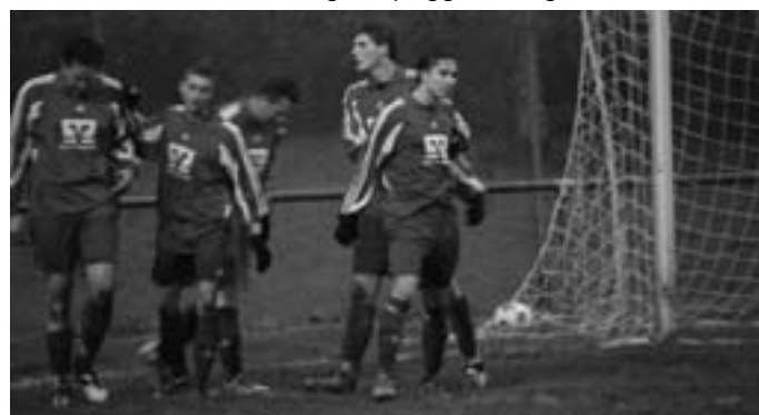
Torjubel nach dem 5:2

In Binsdorf nichts zu holen, die SpVgg siegt verdient gegen ihren Nachbar und Namenskollegen SpVgg Leidringen.