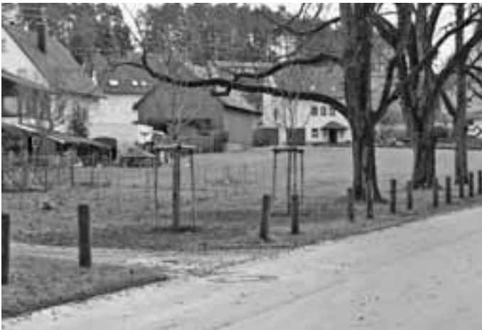
Die beiden jungen Kastanien, die die Mitarbeiter des Bauhof-Teams im Bereich der Alleenstraße gepflanzt hatten.

Eine Lücke in der Kastanienallee im Herzen der Geislinger Kernstadt konnte vor wenigen Tagen geschlossen werden. Mitarbeiter des städtischen Bauhofteams hatten fachmännisch zwei junge Kastanien gesetzt. Im Spätsommer war unter starker Windeinwirkung eine der Kastanien umgeknickt, eine weitere wurde aus Sicherheitsgründen wenige Tage später gefällt - der Baum litt unter Pilzbefall und hatte zudem wie der umgestürzte Baum eine deutliche Schräglage aufgewiesen. Die hieraus entstandene Lücke wurde nun durch die Pflanzung zweier Jungbäume geschlossen. Diese Aktion soll den Fortbestand des Alleencharakters sicherstellen.