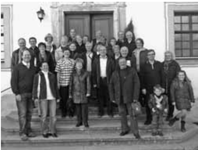
Erinnerungsfoto auf der Schlosstreppe: Eine herzliche Atmosphäre prägte die Begegnung mit den Freunden aus der Partnerstadt Ruoms, die zum voradventlichen Markt angereist waren.

Anlässlich des voradventlichen Marktes in Geislingen war eine Delegation aus der französischen Partnerstadt Ruoms nach Geislingen gereist. Gemeinsam mit den französischen Freunden konnten die Geislinger Gastgeber erneut schöne Stunde mit den Gästen verbringen.