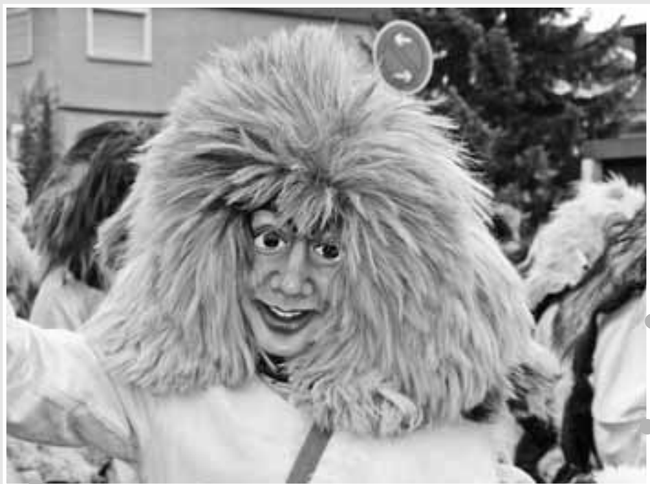
"Heiaso - mir lebet no"

aufgenommen anl. des großen Ringtreffens am 24.1.2010 in Geislingen