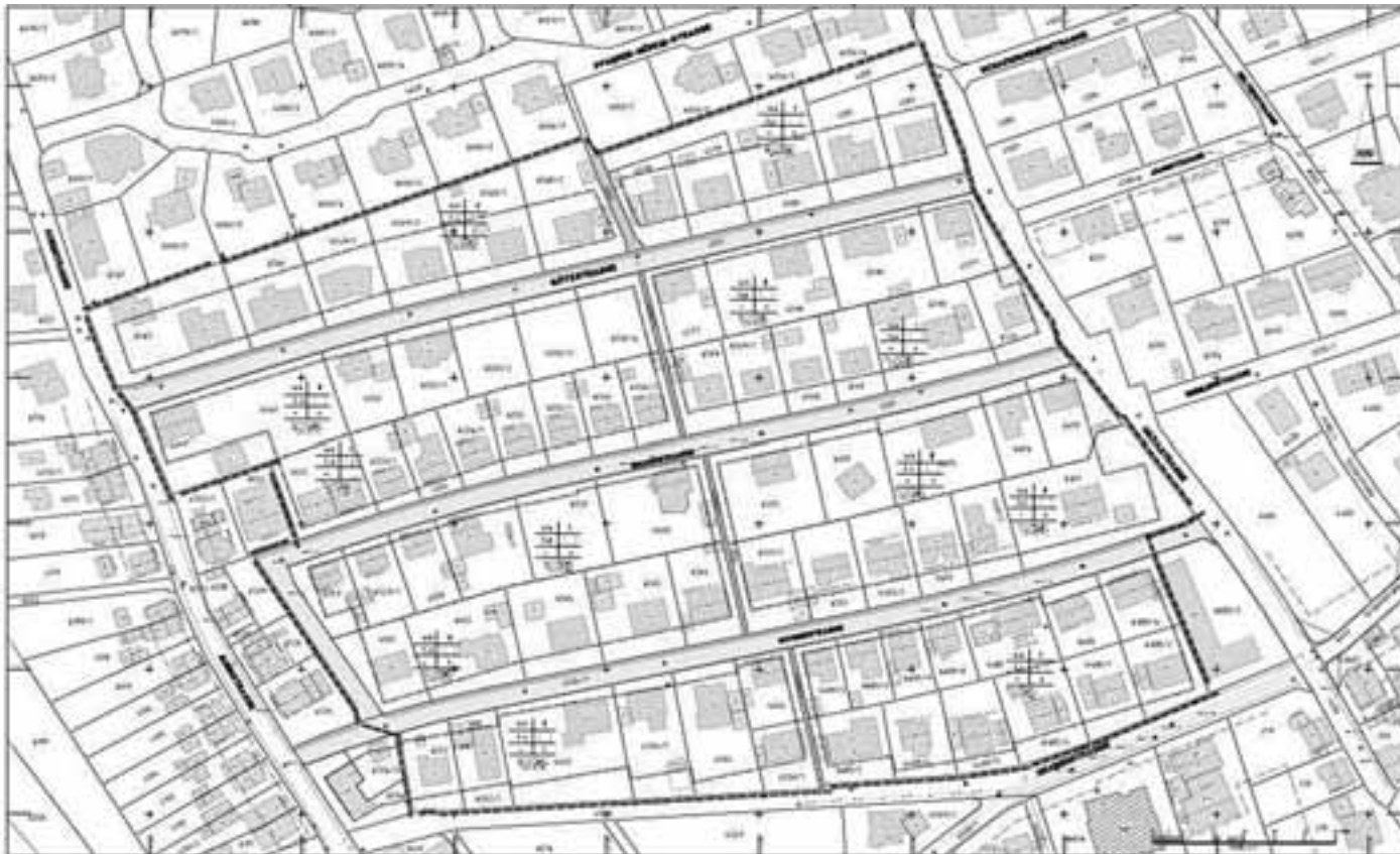
Lageplan „Neufestsetzungen“ Planungsrechtliche Festsetzungen und örtliche Bauvorschriften

Der Gemeinderat hat in der Sitzung vom 26.01.2011 beschlossen, für das Gebiet Beinlen, Gemarkung Geislingen, einen Bebauungsplan - 4. Änderung aufzustellen. Die Änderung ist erforderlich, damit eine zweigeschossige Bauweise ermöglicht werden kann. Einerseits wird hierzu die maximale Gebäudehöhe festgelegt, andererseits werden die Baugrenzen neu geregelt. Der Geltungsbereich der Änderung ist in beiliegendem Lageplan dargestellt.