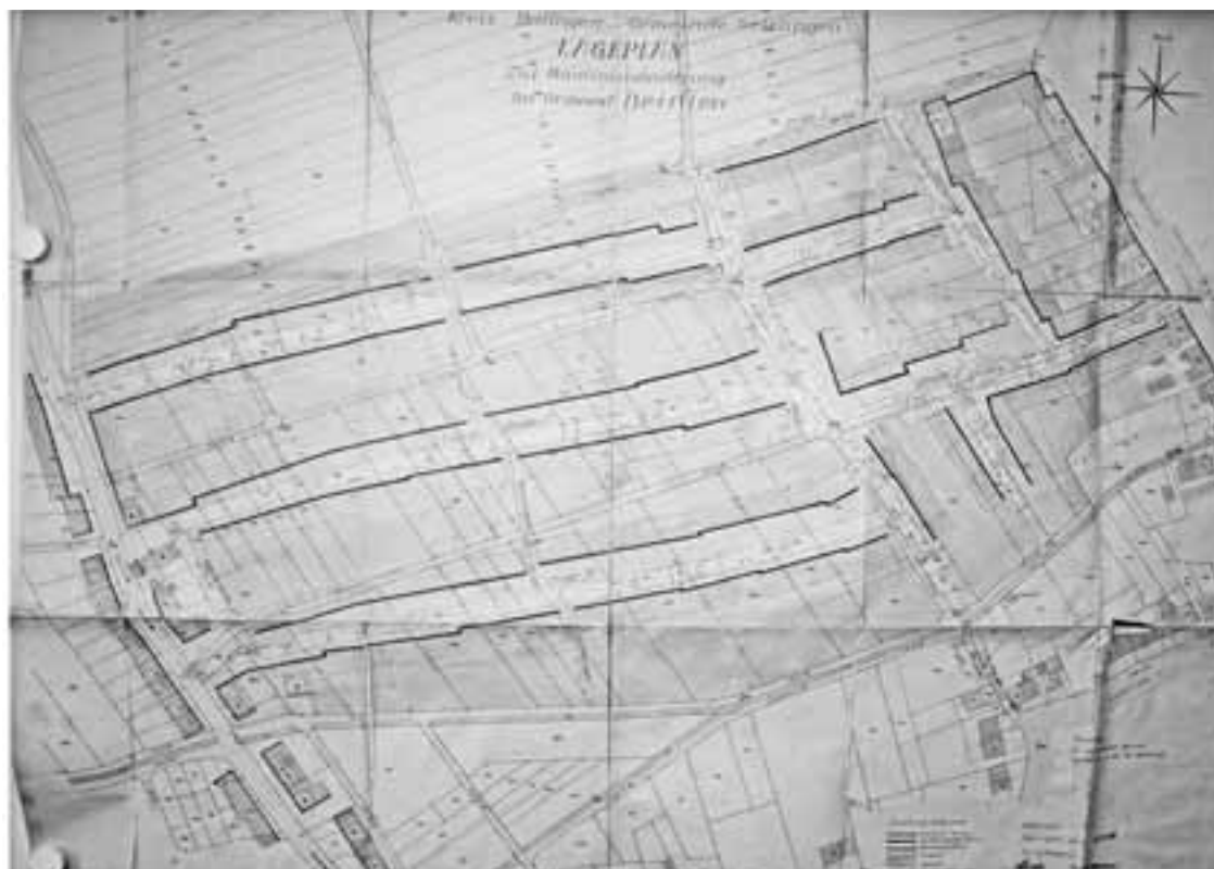
Lageplan „Aufhebungen“ Die dar- gestellten Baulinien wer- den aufgehoben.

Gemäß § 2 Abs. 1 BauGB wird der Aufstellungsbeschluss hiermit bekannt gemacht.