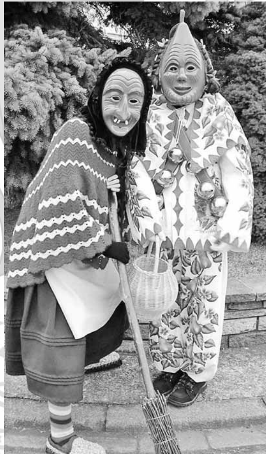
Die Binsdorfer Stadthexe und die Holzhutzel

am Sonntag, 12. Februar 2012 um 13.30 Uhr