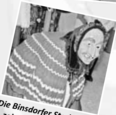
Die Binsdorfer Stadthexe zeigte sich besonders "lebendig"