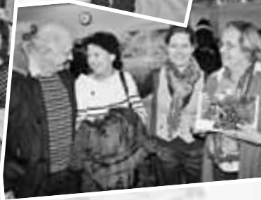
Im Foyer der Schlossparkhalle herrschte eine fröhliche und herzliche Stimmung