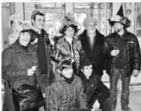
Gäste aus dem italienischen Treiso

Ein gemeinsames Mittagessen am Sonntagmittag bildete den Abschluss des gelungenen Wochenendes, bevor die Gäste die Rückfahrt antraten, erfüllt von "ganz neuen" Impressionen aus Geislingen.