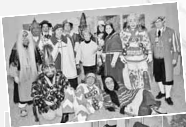
Die Vertreter der Zünfte und Gruppierungen aus den drei Stadtteilen stellten sich den ausländischen Gästen vor und präsentierten die Geislinger Fasnet