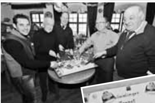
Zum Abschluss zeigte sich die Fasnet von Ihrer besonders "süßen" Seite