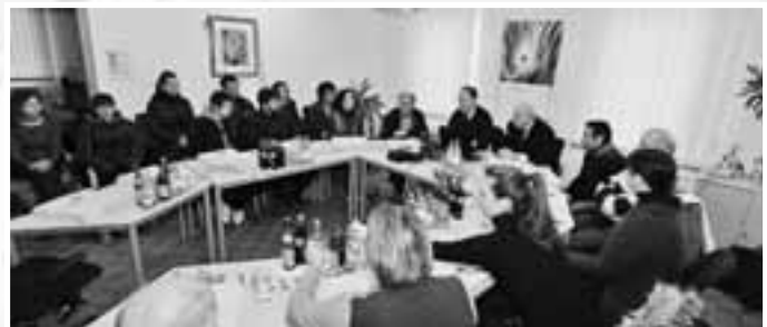
Treffen der Gäste aus Treiso mit dem Bürgermeister und Vertretern des Städtepartnerschaftskomitees