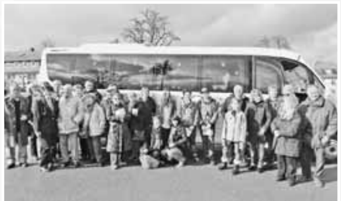
Die Delegation aus Ruoms vor deren Heimfahrt nach Ruoms