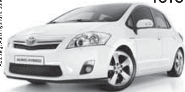
Abb. zeigt Auris Hybrid m. Sonderausstattung