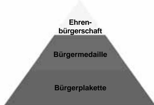
Tabellarische Aufstellung des dreistufigen Ehrungsmodells der Stadt Geislingen