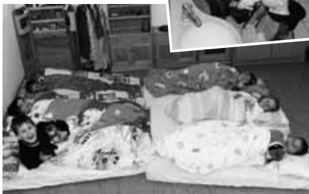
Nach dem Essen ist im separaten Schlafräum eine Ruhepause vorgesehen.

Für die Gesundheit der Zähne wird tagsüber immer wieder mit gemeinschaftlichem Zähneputzen gesorgt.