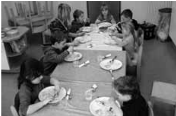
Zum Mittag wird eine warmes Essen gereicht

Wie lassen sich Familie und Beruf besser vereinen? Die Stadt Geislingen hat vor Jahren mitunter das Angebot „Ganztagesbetreuung“ in den Kindergärten, auch für die ab zwei Jahren alten Kinder, erweitert. Damit setzt der Gemeinderat und die Stadt wiederum ein Signal für eine kinderfreundliche Stadt Geislingen. Im Kindergarten Pusteblume und Kindergarten Regenbogen sind altersgemischte Ganztagesgruppen eingerichtet. Dieses Angebot ist ein fester Bestandteil dieser Einrichtungen und erfreut sich immer mehr der Nachfrage. Die Kinder verbringen die meiste Zeit des Alltags in der pädagogischen Einrichtung zusammen mit anderen Kindern. Sie werden liebevoll von den Erzieherinnen betreut und in ihrer Entwicklung gefördert.