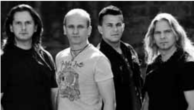
And the winner is DEIN eX, hieß es in den letzten Monaten mehrmals bei einschlägigen Wettbewerben von Rundfunksendern und aus dem Musik-Business. Die Wendlinger Deutsch-Rocker sind Top-Act am ersten Festivaltag des „Umsonst & Draußen Zollernalb“ am 11. September in Geislingen.