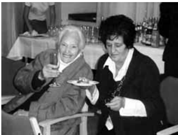
Bleib wer du bist, im Altenzentrum St. Martin